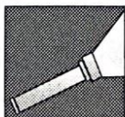
torcia elettrica: lampada

uniti : vicini, compatti. Il contrario di separati. Es.: i vagoni del treno sono uniti.