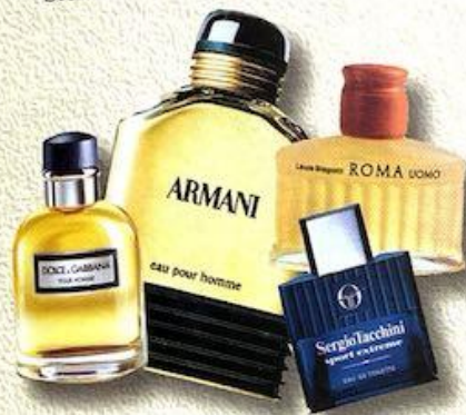
Ogni stilista ha la sua linea di profumi da uomo e da donna

Moda italiana, però, non significa solo abbigliamento. Molto noti sono gli occhiali della Luxottica , che è il più grande produttore del mondo; collabora con Armani , Byblos , Vogue e le più importanti firme del settore.